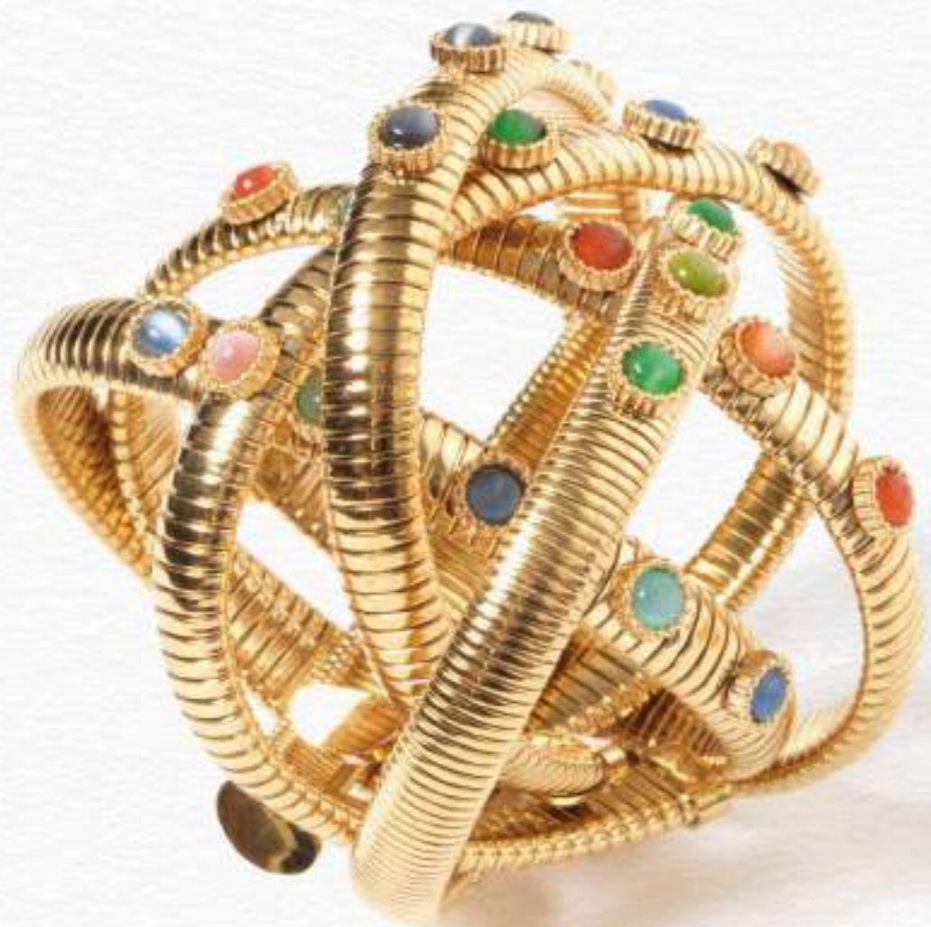
SET NEW CRISOLITE